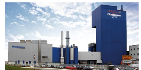
Das Werk Breidenbach der Buderus Guss GmbH im Jubiläumsjahr 2013