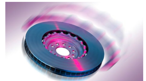
Die Zukunft gehört den Leichtbau-Bremsscheiben